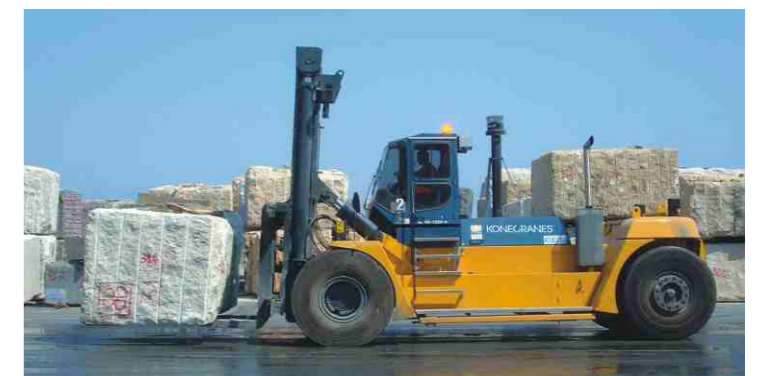
重若岩石。超大重量的大型石块需要更有动力的叉车(25-45吨)