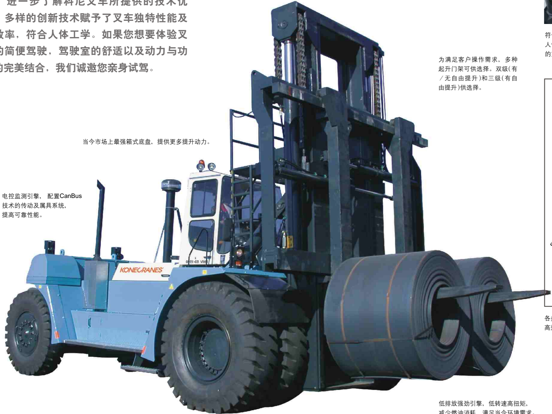
当今市场上最强箱式底盘，提供更多提升动力。

进一步了解科尼叉车所提供的技术优势。多样的创新技术赋予了叉车独特性能及高效率，符合人体工学。如果您想要体验叉车的简便驾驶，驾驶室的舒适以及动力与功能的完美结合，我们诚邀您亲身试驾。