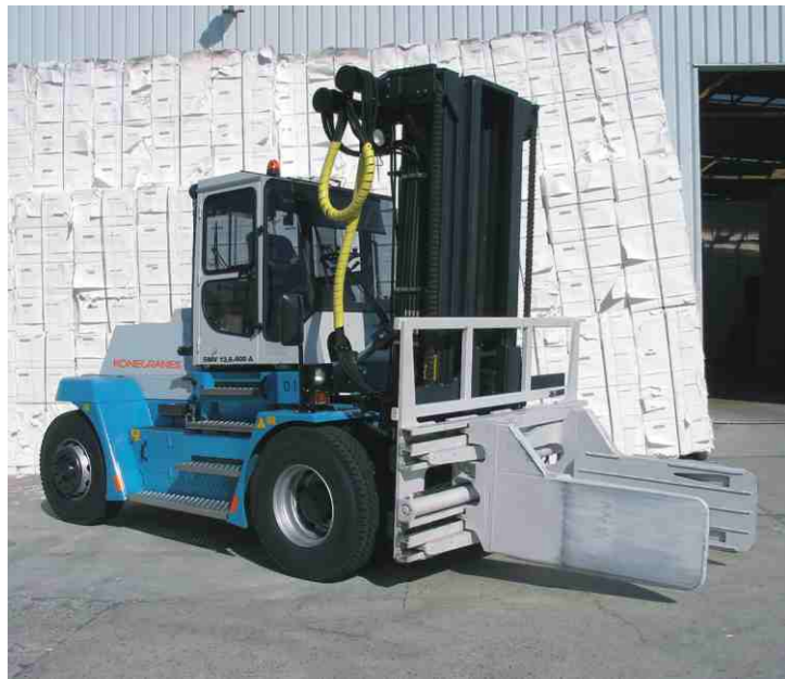
配备夹钳用于纸包作业(10-13.6 吨)