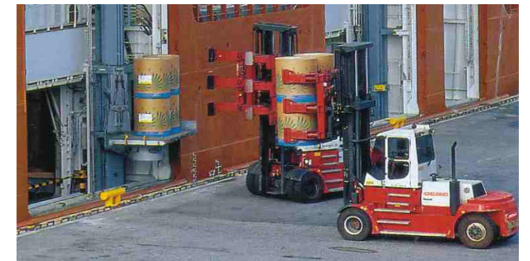
作业于纸卷的安全紧夹，一次搬运2,4或6卷(12-16吨)