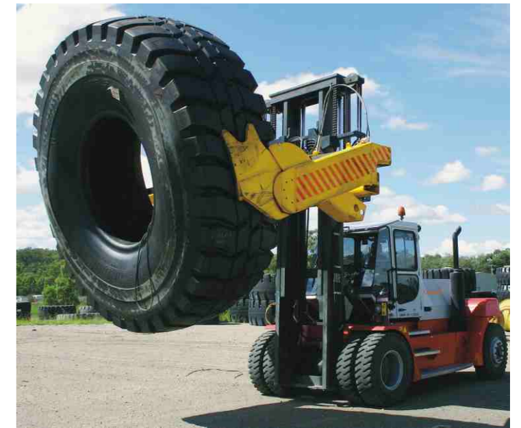
巨型矿车更换轮胎需要精确度较高叉车(15-25 吨)

在过去的半个多世纪之间，Konecranes Lifttrucks与各行业紧密合作，生产了动力大，满足客户要求且表现出色，具有最优可靠性能的叉车。木材，钢板，纸张，混凝土，机械及工业产品等重物运输是科尼叉车的日常作业内容。