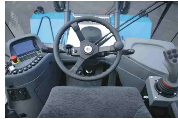
符合人体工学的驾驶室设计，提供最佳的舒适化、人性化及宽广视野。噪音低，震动小，便于操作的方向盘柱及控制面板。