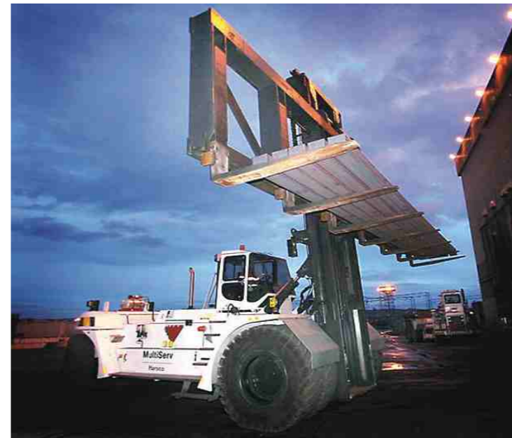
强大动力适应繁重原材料作业。 满足钢板、卷钢搬运作业需求的大型叉车(最大起重量为60吨)。