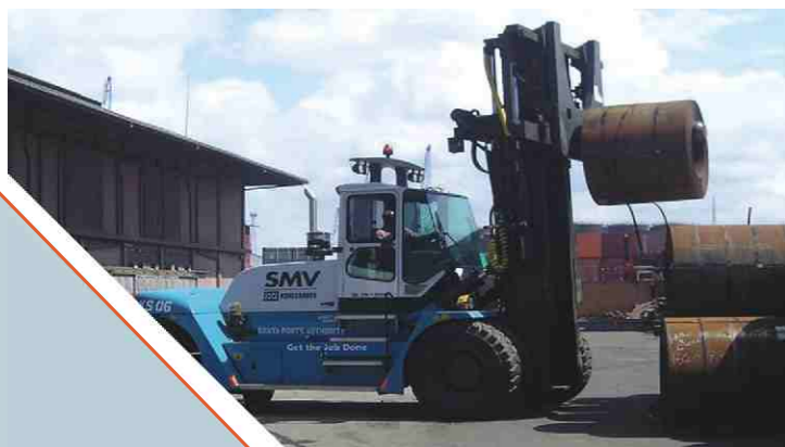
大型叉车处理卷钢和钢板作业(10-60 吨)