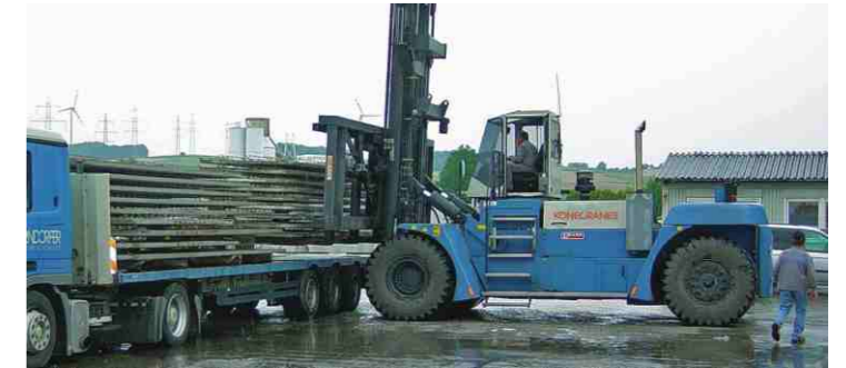
沉重的混凝土物料作业需求加宽货叉架和侧置驾驶室(16-42吨)