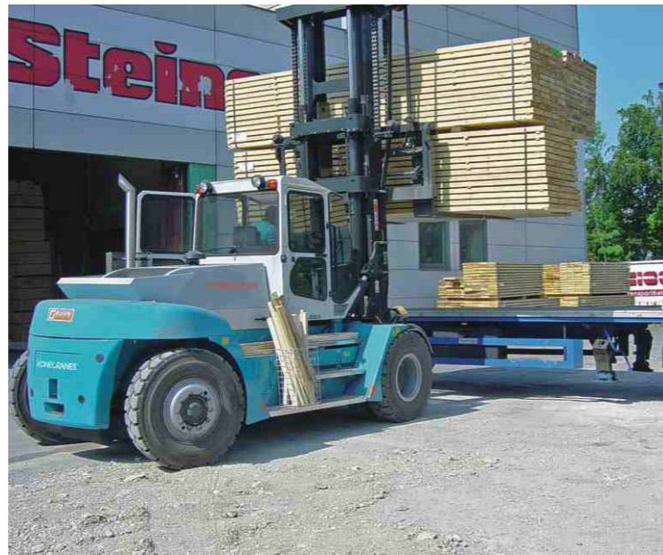
符合锯木厂作业环境需求的叉车(12-16 吨)